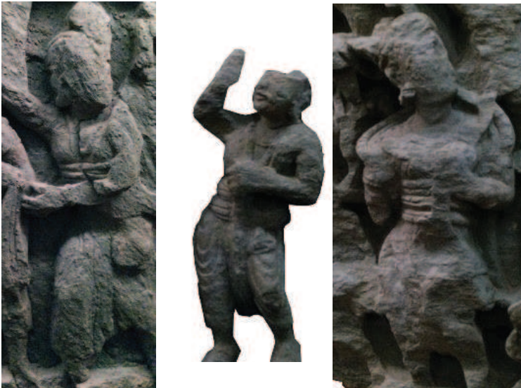
C. Type III – “lorica laminata” (?)