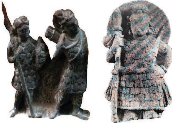
B. Type II – scale coat