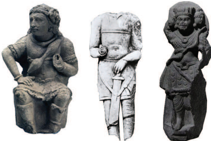
D. Type IV – muscle cuirass derivatives