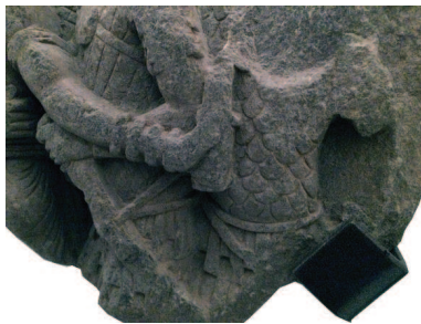
A. Type I – corselet with pteryges