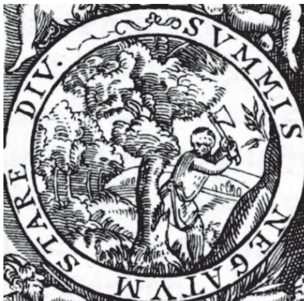
Рис. 4. Титульная гравюра из французского издания «Правдивых и ужасных известий о жестоком враге московите» (1563 г.)