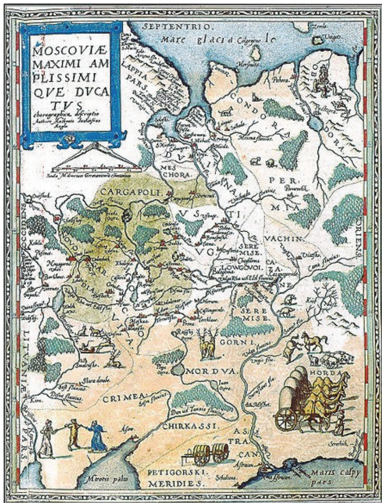
Рис. 2. Карта Московии Антония Дженкинсона и Георга де Йолде (1593 г.)