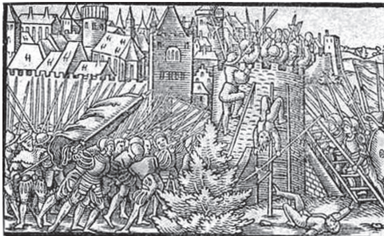
Рис. 3. Штурм Пскова/Полоцка в аугсбургском листке «Правдивые и ужасные известия о жестоком враге московите» (1563 г.)