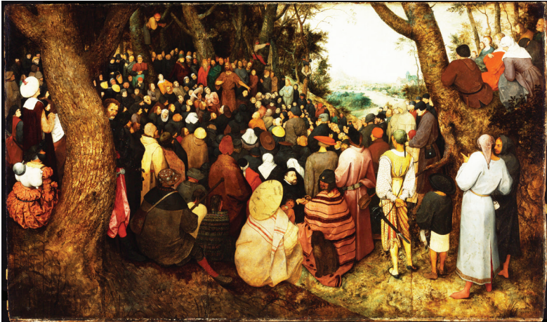
Рис. 2. Питер Брейгель «Проповедь Иоанна Крестителя» 1566 г.