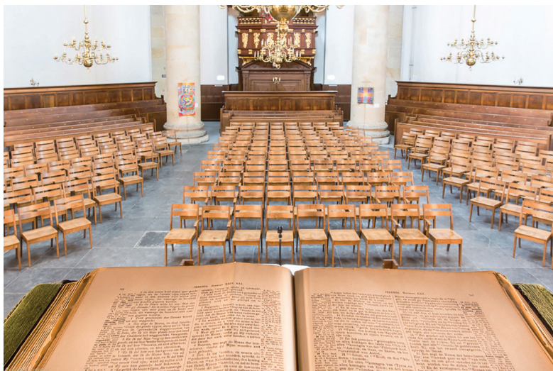
Рис. 6. Вид с кафедры проповедника в церкви Марекерк (Лейден)