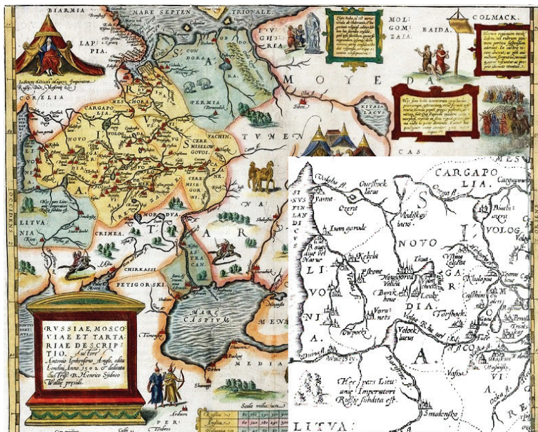
Рис. 1. Карта Антония Дженкинсона «Описание России, Московии и Тартарии» (1562 г.)