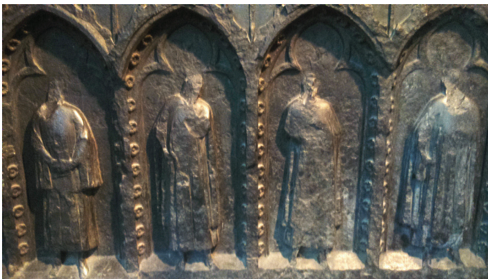
Рис. 4. Фрагмент раки епископа Гая ван Авеснеса (1317 г.) из собора св. Мартина в Утрехте, поврежденной иконоборцами в 1580 г.