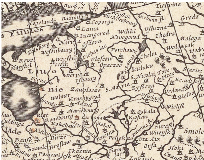
Рис. 6. Фрагмент «Карты Европы, исправленной и дополненной» Пьера Бергиуса (1627 г.)