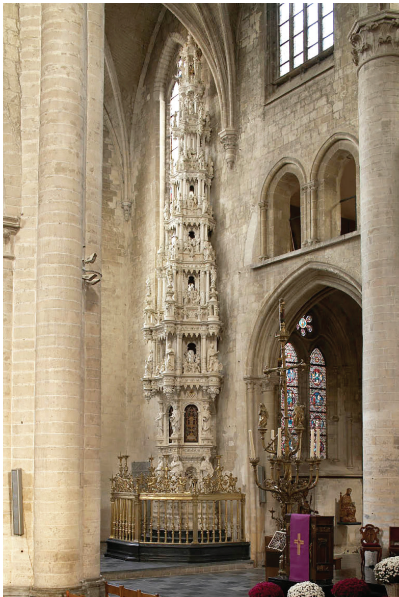
Рис. 7. Дарохранительница в церкви св. Леонарда (Зутлеуве) (Корнелис Флорис де Френт, 1550–1552 гг.)