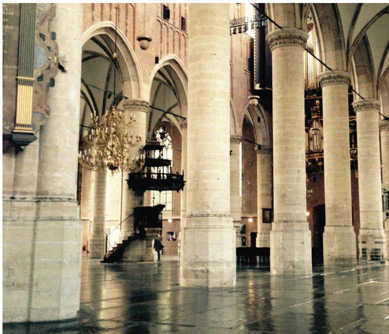
Рис. 5. Кафедра проповедника в церкви Марекерк (Лейден)