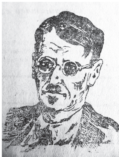
Рис. 1. Изображение Р. Маршана в газете «Псковский набат»

статья Маршана о царевице Алексее (сыне Петра I), и тогда же — книга о внутренней политике России. В 1917 г. в качестве корреспондента «Фигаро» он находился в России, и вскоре стал приверженцем социалистических идей. Причины этого он сам объяснил в брошюре «Почему я связан с формулой “социальная революция”»: махинации, маневры, заговоры и покушения, предпринятые посольствами Антанты в начале революции и происходившие на его глазах, возмутили французского журналиста и заставили оказаться на другой стороне баррикад 1 .