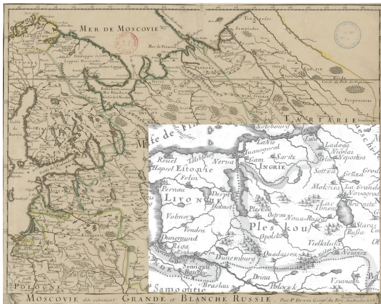
Рис. 7. Карта Дюваля Пьера «Московия, иначе называемая Большая и Белая Россия» (1677 г.)