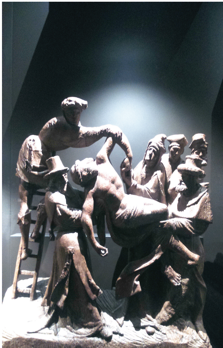
Рис. 8. Фрагмент деревянного алтаря XVI в. (музей Боннефантен, Маастрихт)