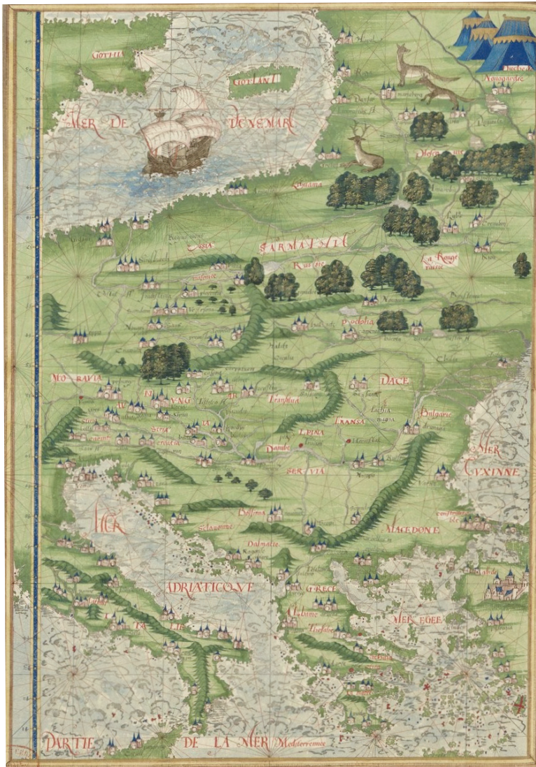
Рис. 5. «Южная и Восточная Европа» из сборника морских карт «Всеобщая космография» Гийома Ле Тестю (1555 г.)