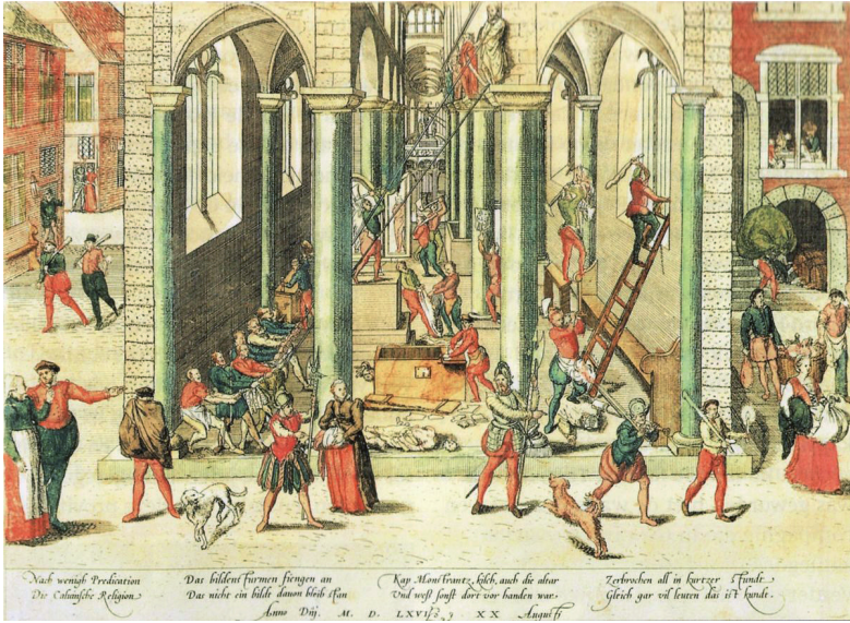
Рис. 1. Франц Хогельберг Кальвинистское иконоборческое восстание, 20 августа 1566 г. (Гамбургский художественный музей)