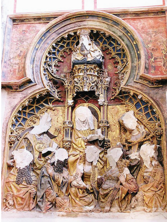
Рис. 3. Заалтарный образ св. Анны из собора св. Мартина в Утрехте, поврежденный иконоборцами в 1580 г.