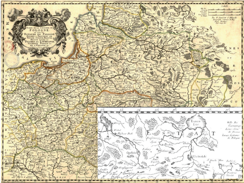
Рис. 8. Карта Николая Сансона «Владения польской короны или королевства Польши, герцогства и провинции Пруссии, Куявии, Мазовии, Черной России, княжества Литовского, Волынского, Подольского и др., Украины» (1663 г.)